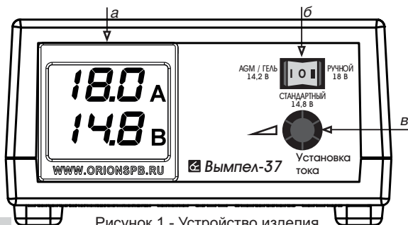
Рисунок 1 - Устройство изделия