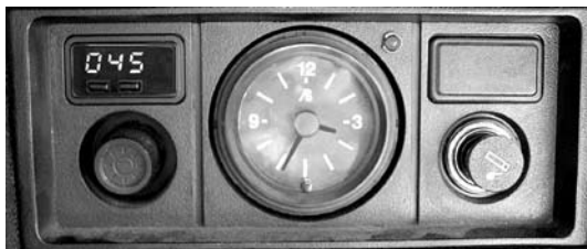
Рис.1 Вид установленного БК в консоли а/м ВАЗ 2107

ПЕРЕД НАЧАЛОМ РАБОТЫ ОТКЛЮЧИТЕ КЛЕММУ "МАССА" ОТ АККУМУЛЯТОРНОЙ БАТАРЕИ!