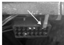
Рис.3 Диагностическая колодка

4.5 При наличии в вашем автомобиле сигнальной лампы "CHECK ENGINE", которая находится справа от водителя на консоли приборов произведите следующее действие. Подсоедините жгут БК для подключения лампочки аварийного сигнализатора к соответствующим колодкам сигнальной лампы "CHECK ENGINE" и БК (см. рис. 4 ). Соединение производится при помощи зажимов. Схематичное соединение проводов через зажим показано на рис.5.