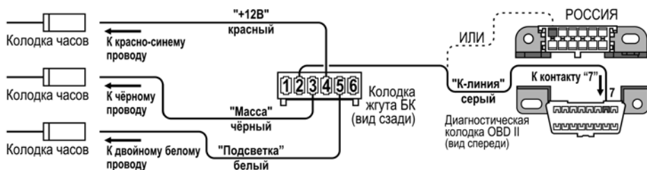
Рис.2 Схема подключения БК

4.1 К контакту колодки часов подходит красно-синий провод (заводской).