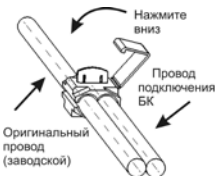
Рис.5 Соединение проводов через зажим