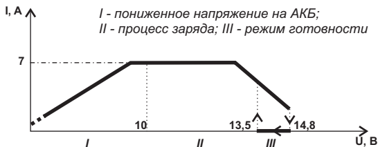
Рисунок 2 - Вольт-Амперная характеристика работы Вымпел-15 и Вымпел-18 (схематично)